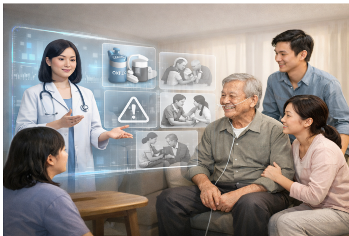
图2 数字人在家庭场景中对家属与患者照护教育的指导

因此,数字人在呼吸慢病宣教和管理中的价值不在于其技术形式本身,而在于其能够将既往难以系统完成的教育任务流程化、模块化和长期化。这种能力使其有望从“辅助宣教工具”进一步发展为“慢病教育基础设施”的一部分 [6-7,14-16] 。