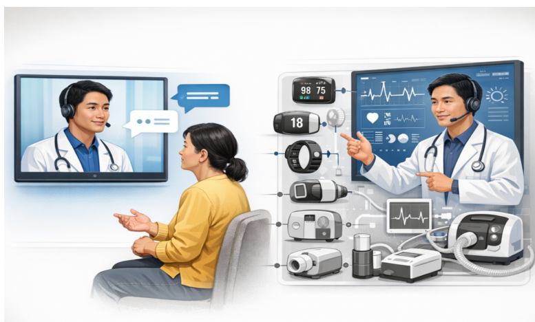
图3 物联网赋能数字人和虚拟专家对现实场景的感知能力